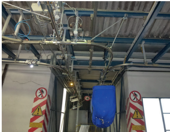
TRANSFERT DE SLING