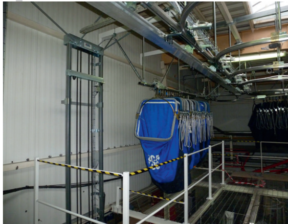
TRANSFERT DES VIDES