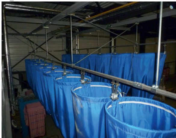
STOCKAGE EN LIGNES