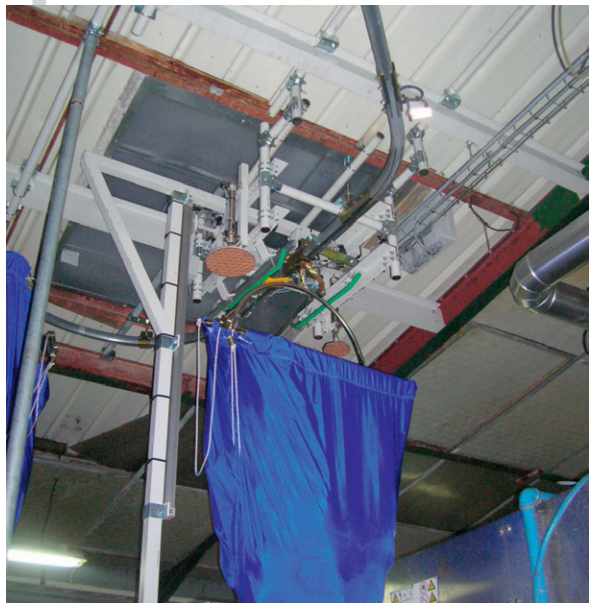
SLING MONO TROLLEY