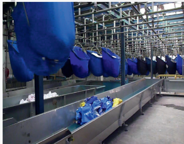
DECHARGEMENT SUR TAPIS