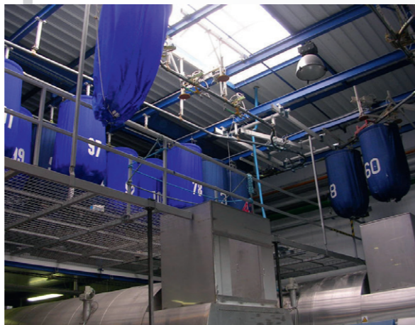
SLING DOUBLE TROLLEYS