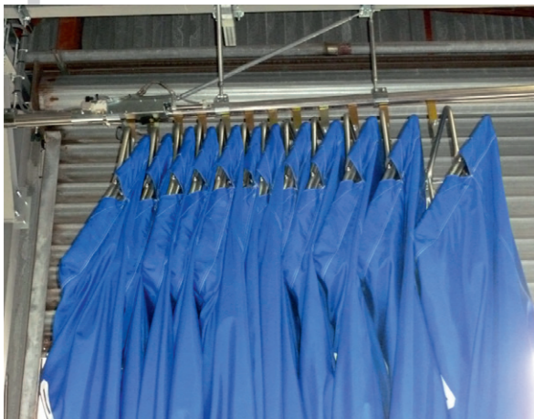
STOCKAGE DES VIDES